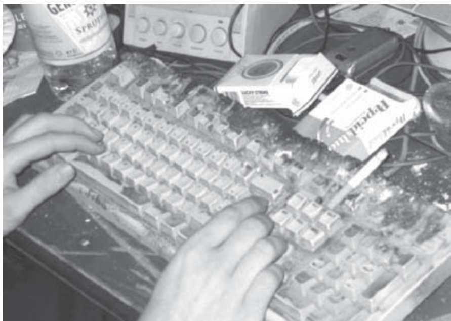
Beim Computerfreak (gefunden im Internet)

Monaten in zunehmendem Ausmaß Chatrooms frequentiert. Es sei zu einer Art Toleranzsteigerung gekommen, die Hausfrau habe Online-Zeiten von bis zu sechzig Stunden pro Woche erreicht. Sie habe sich bald auf einen bevorzugten Chat konzentriert, wo sie sich „etablierte“ und eine Art Gemeinschaftsgefühl entwickelte. Sehr bald konnte sie, entgegen besserer Absicht, die Zeit der verbrachten Sessions nicht mehr kontrollieren. Diese hätten manchmal bis zu 14 Stunden gedauert. Wenn sie nicht online sein konnte, habe sie zunehmend unter depressiven Verstimmungen, Angstzuständen und Irritabilität gelitten. In der Folge begann sie, Verabredungen nicht mehr einzuhalten und ihre Freunde, ebenso wie ihr Familienleben zu vernachlässigen. Auch ging sie keinen sozialen Aktivitäten mehr nach, die sie früher gerne ausgeübt hatte.